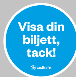
11. Visa biljett

Betalinformationsdekaler i bild är exempel. Använd alltid aktuell version!