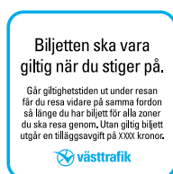
3. Tilläggsavgift. Exempel