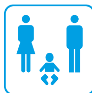
WC med skötbord 1 st, 80x80 mm