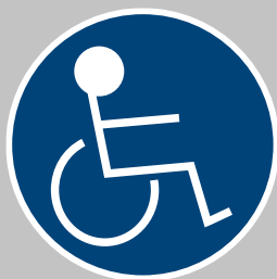
6. Rullstol höger Ø130