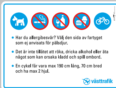
7. Samlad information, fartyg cyklar