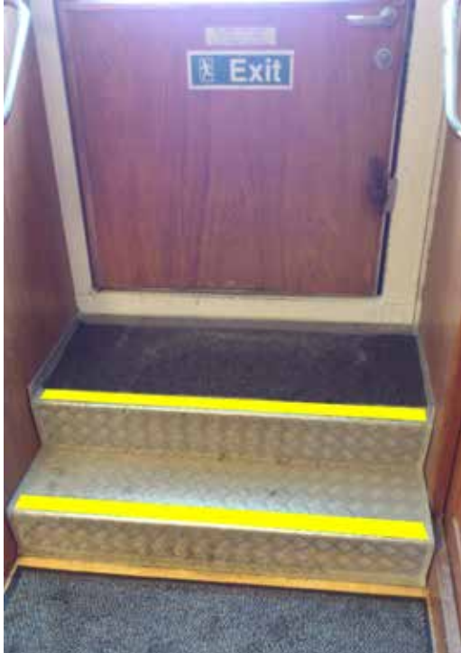
Ingångstrappa, markeras med svart eller gul antihalkmaterial