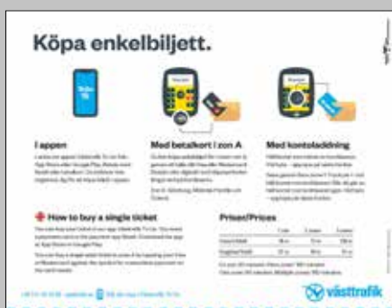
8. Enkelbiljett Generell. Exempel