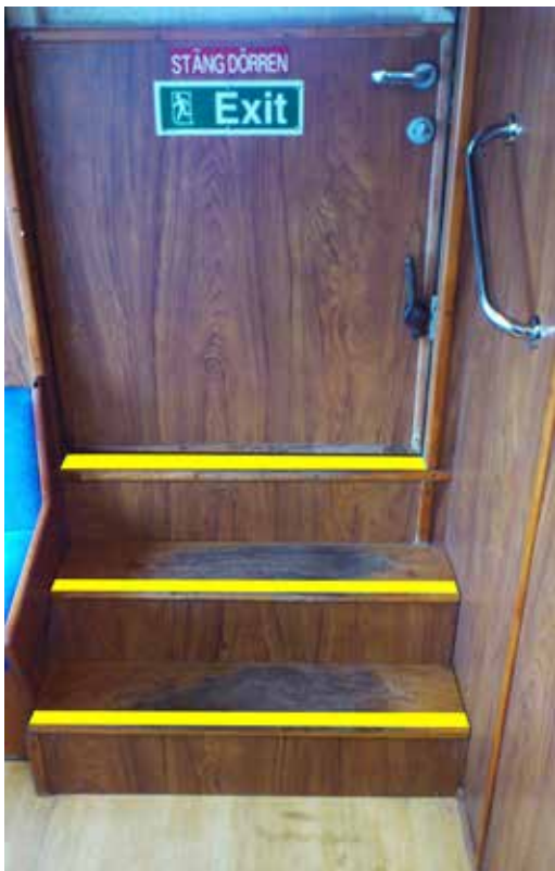
Trappsteg akter, markeras med gul antihalkmaterial