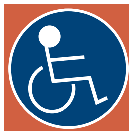
Rullstol höger 1 st Ø130 mm.

Dekal för rullstolsplats, Ø130 mm. Styrbords sida