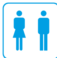
5. WC, dam & herr