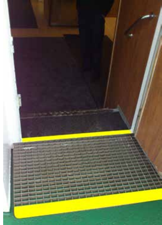
Ingång sedd utifrån, tröskel och fotskrapa målas gul enligt bild.