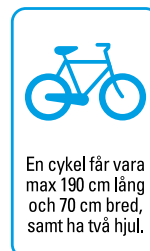
10. Plats för cyklar.