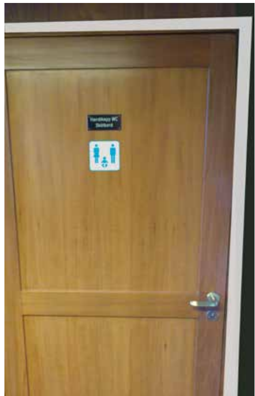
Fasta karmar runt toadörrar målas i kontrasterande färg. NCS S 1002-Y.