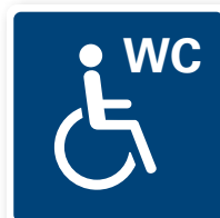
20. WC rullstol 80x80 mm. PMS 295C Placeras på fartyg med tillgänglighetsanpassad toalett.