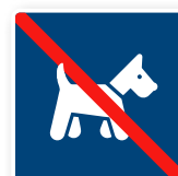
19. Pälsdjur ej tillåtna