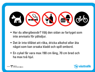
7. Samlad information Fartyg