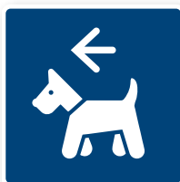
17. Pälsdjur tillåtna, vänster 80x80 mm PMS 295C