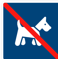
19. Pälsdjur ej tillåtna 80x80 mm. PMS 295C och PMS Red 032 C