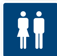
13. WC dam & herr 80x80 mm. PMS 295C