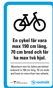
15. Plats för cyklar.