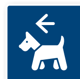
17. Pälsdjur tillåtna, vänster