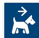
18. Pälsdjur tillåtna, höger