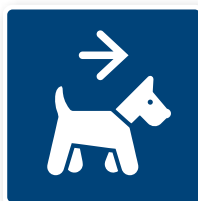
18. Pälsdjur tillåtna, höger 80x80 mm. PMS 295C