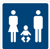
12. WC med skötbord