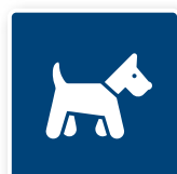
16. Pälsdjur tillåtna