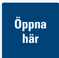
11. Öppna här 80x80mm PMS 295C Placeras vid tryckknapp.