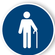
4. Prioriterad sittplats