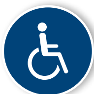
3. Rullstol höger,