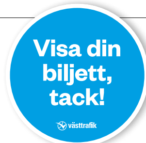
21. Visa biljett