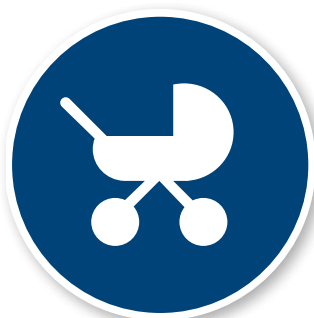
10. Barnvagnsplats Ø130mm PMS 295 C (Om barnvagns- plats finns)